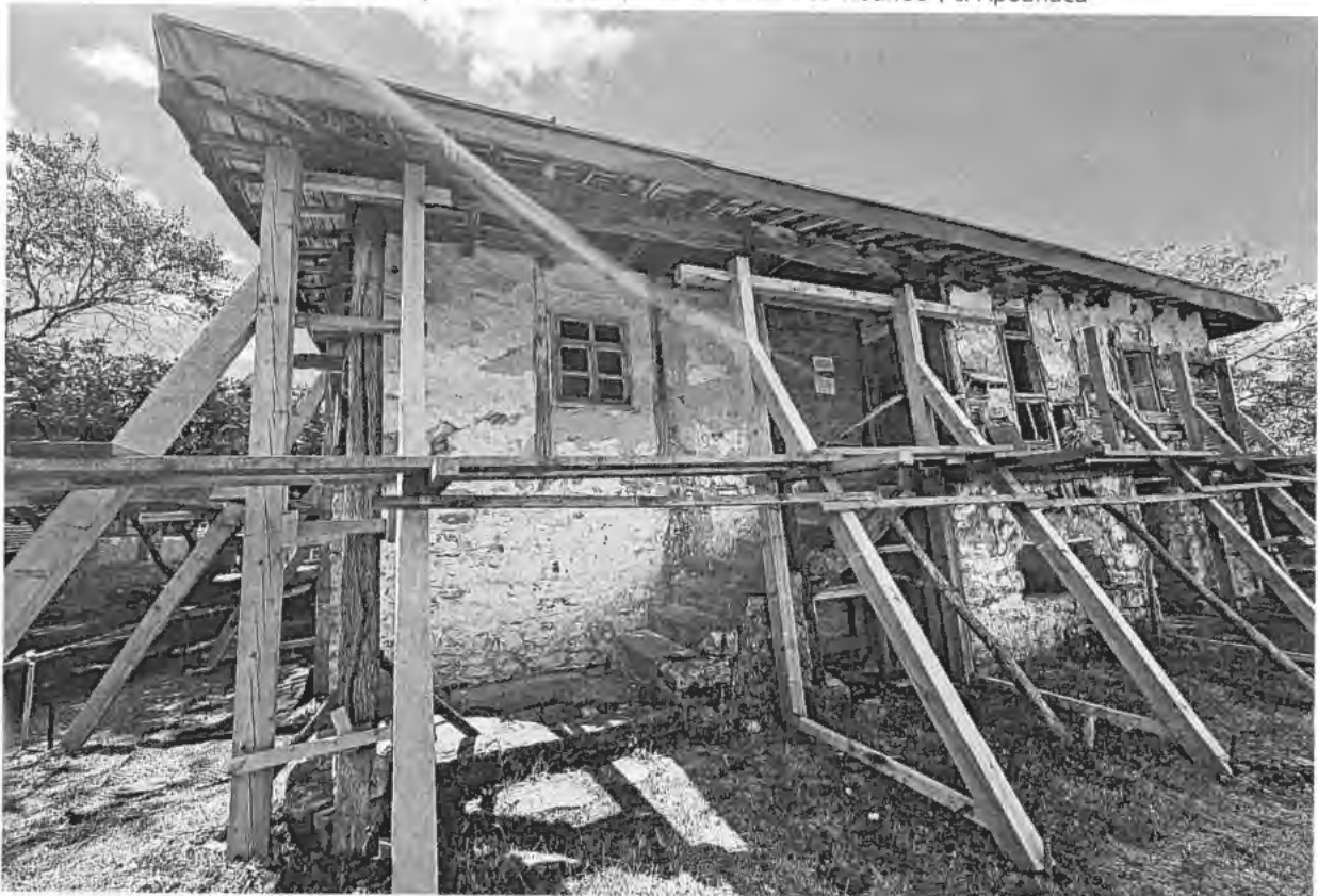
Изглед от североизток на ЕАНКЦ „Къща на Пею Пенчев Иванов“, с. Арбанаси