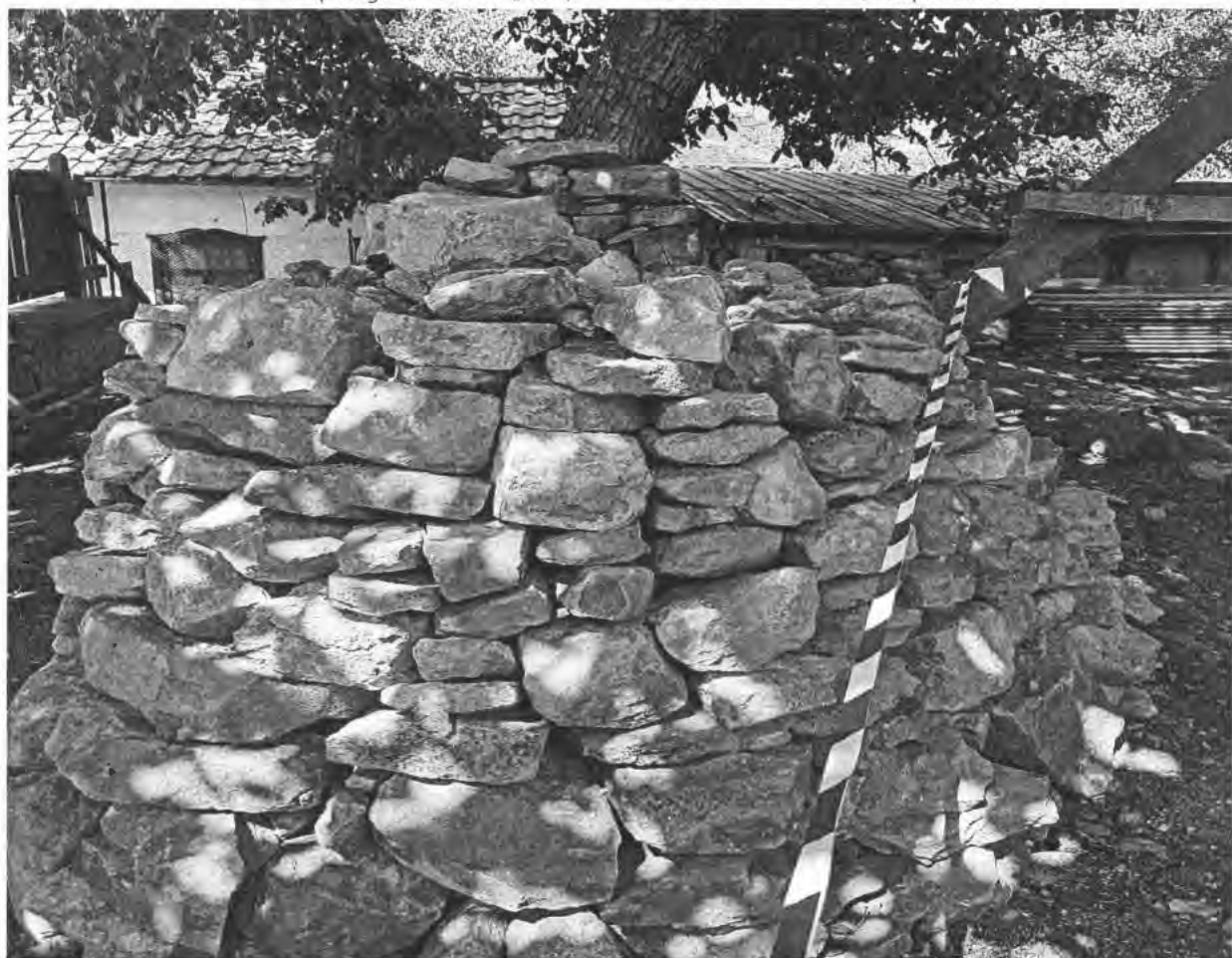
Складираните камъни от черната