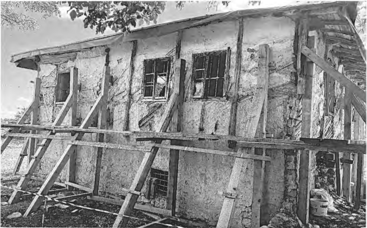
Изглед от запад на ЕАНКЦ „Къща на Пејо Пенчев Иванов“, с. Арбанаси