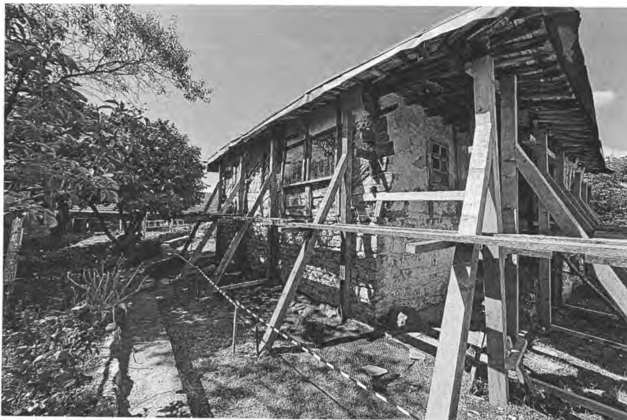
Изглед от североизток на ЕАНКЦ „Къща на Пејо Пенчев Иванов“, с. Арбанас