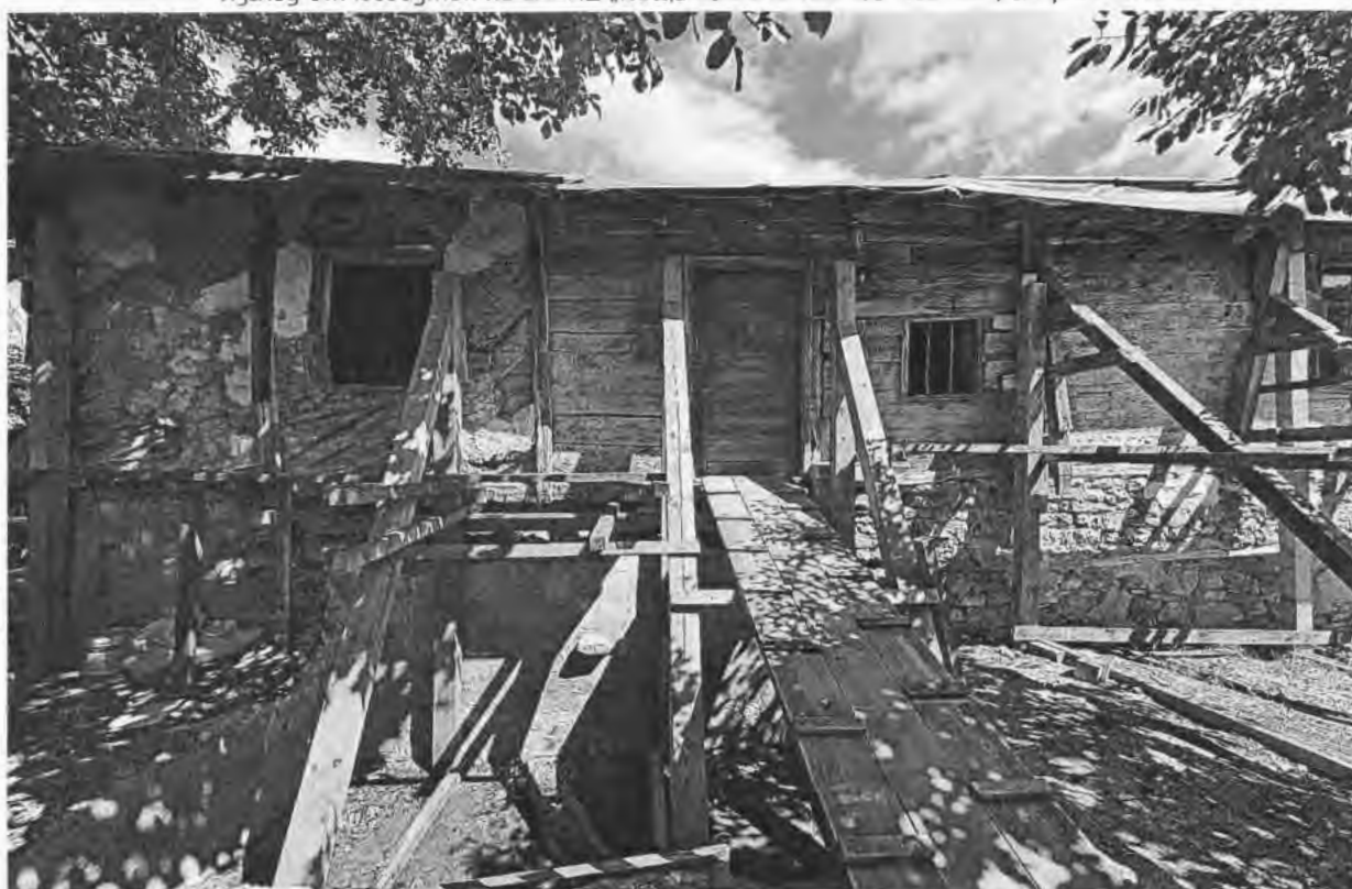
Изглед от юг на ЕАНКЦ „Къща на Пејо Пенчев Иванов“, с. Арбанаси с части от черната