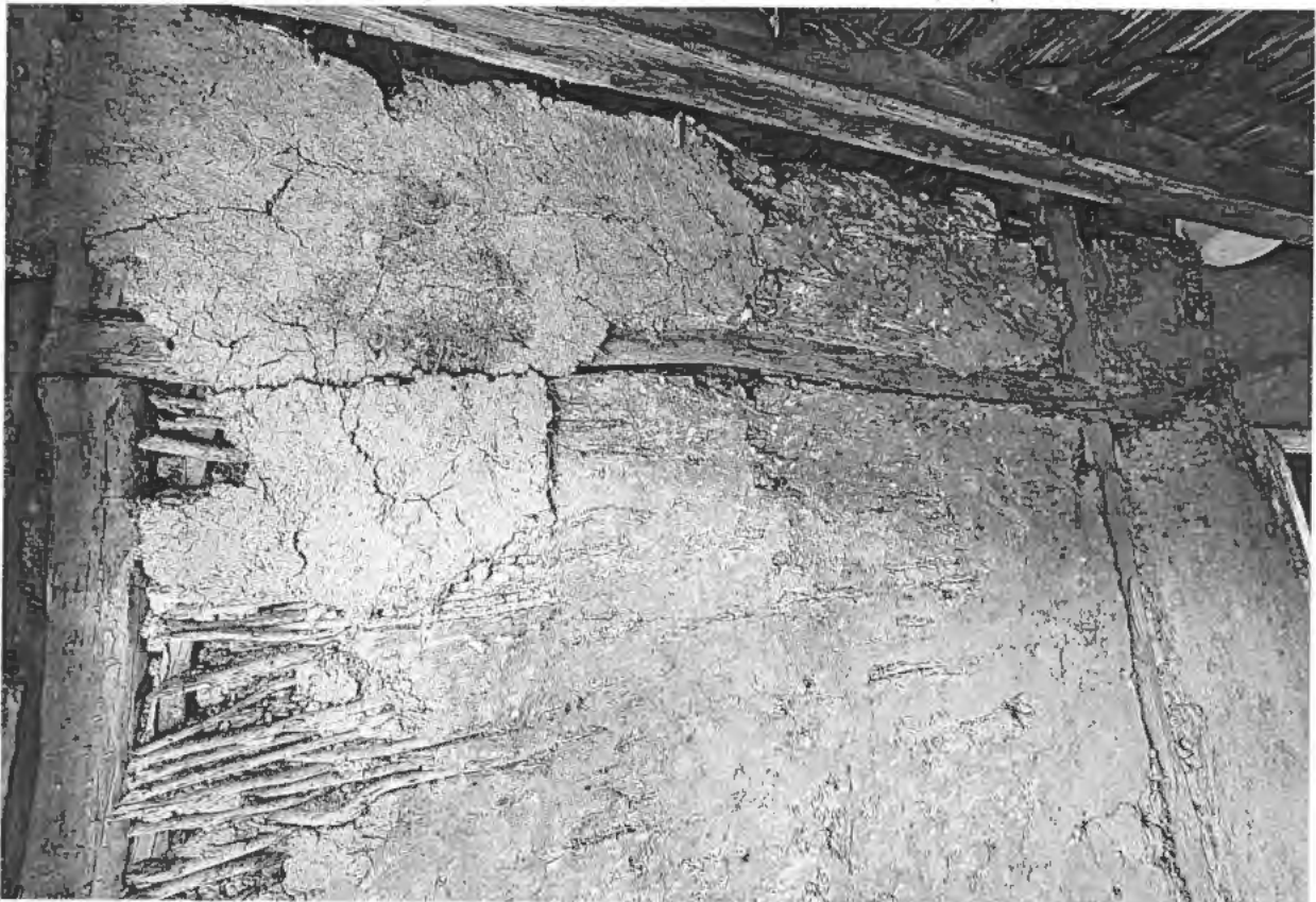
Вътрешна стена на жилищната сграда ЕАНКЦ „Къща на Пејо Пенчев Иванов“, с. Арбанаси