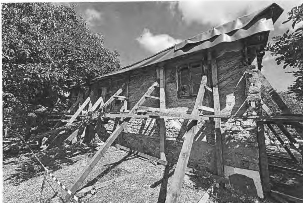
Изглед от югоизток на ЕАНКЦ „Къща на Пејо Пенчев Иванов“, с. Арбанаси