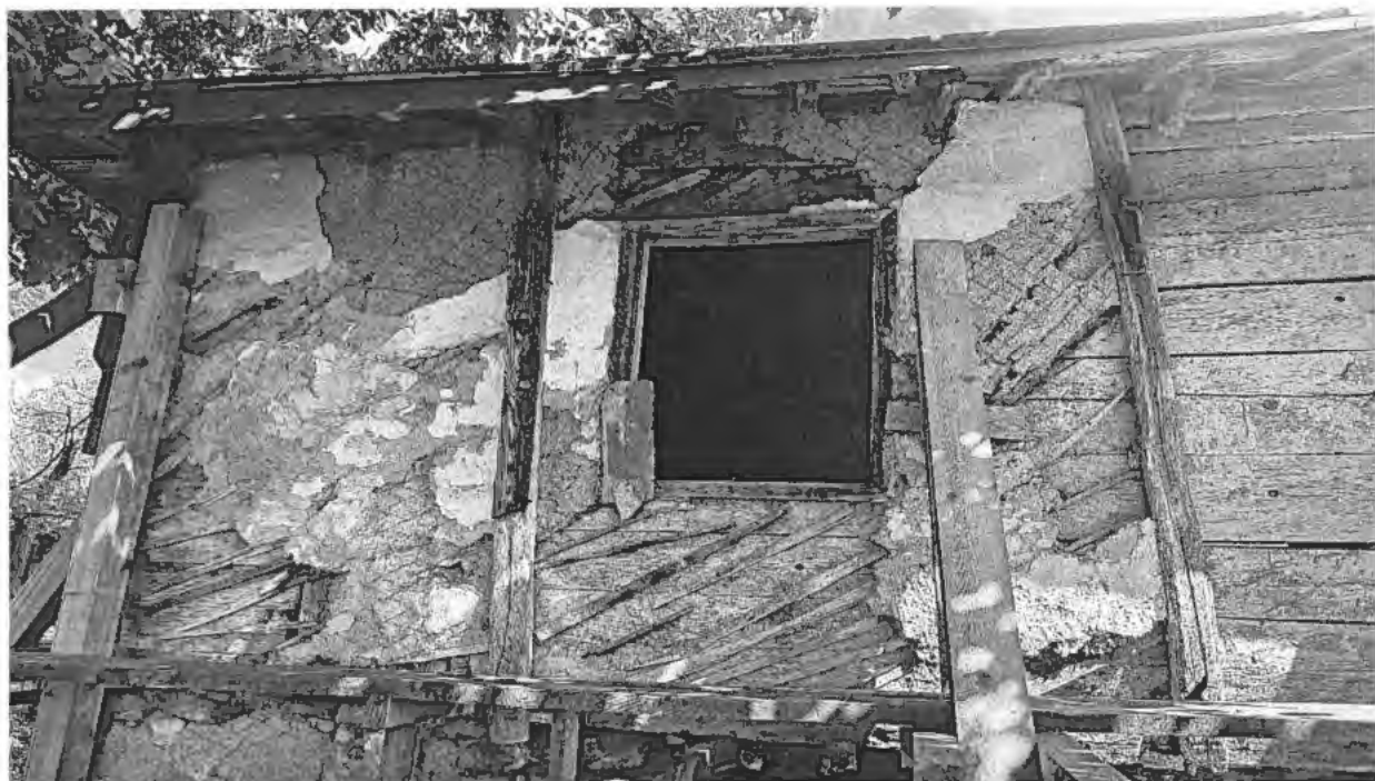
Южна фасада на ЕАНКЦ „Къща на Пейо Пенчев Иванов“, с. Арбанаси