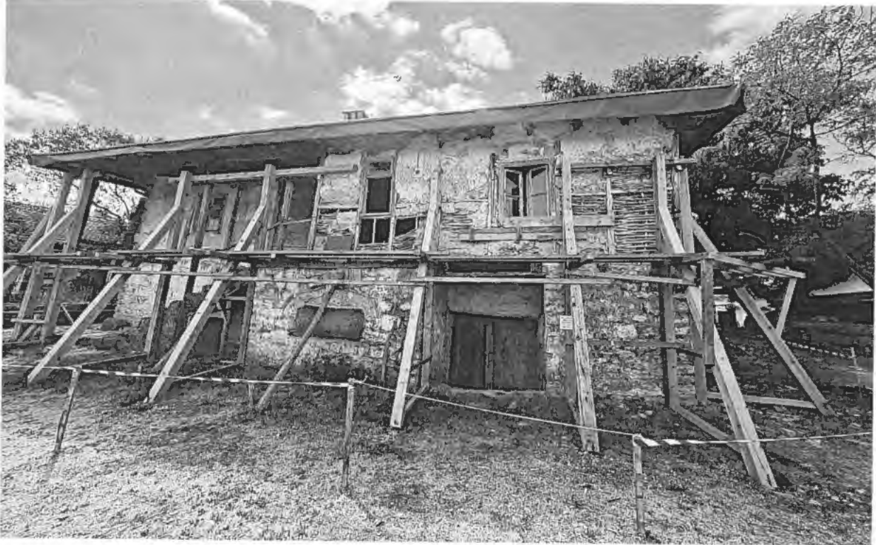
Изглед от север на ЕАНКЦ „Къща на Пею Пенчев Иванов“, с. Арбанаси

Приложената фотодокументация е неразделна част от констативния протокол.