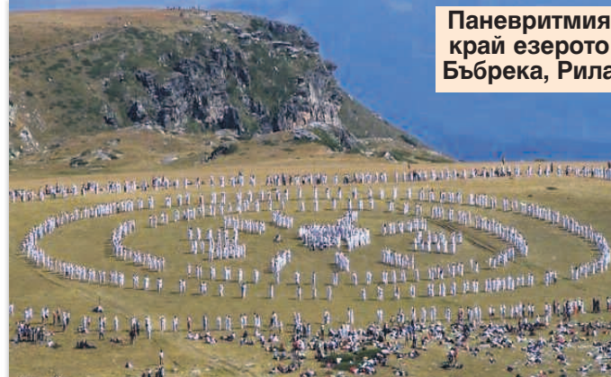
Паневритмия край езерото Бъбрека, Рила

Богомилството, които Българската православна църква не признава. Учението на Бялото Братство проповядва Любов към Бога без посредници, защото всяка човешка душа е част от Бога.