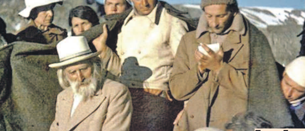
Петър Дънов (1864-1944) произнася около 7000 беседи

Условията, в които живеем. Тези, които правилно са разбрали и правилно са приложили каквато и да е част от това учение, са усетили положителната му страна. Всеки човек има вътрешен усет кое е истинно. Рано или късно Божественото винаги намира път към сърцето на човека.